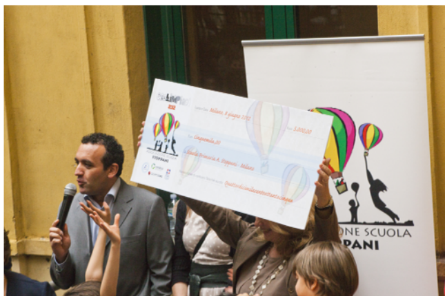
Cerimonia di consegna alla Scuola Stoppani di un assegno di 5.000 Euro da parte dei partner delle Eco-limpiadi (8 giugno 2012)

Le Eco-limpiadi , realizzate grazie a Tetrapak, Comieco, Centrale del Latte Milano e Gruppo CMS sono state un gioco divertente e istruttivo e hanno permesso alla scuola di ricevere 5.000 Euro per creare la nuova Aula Video.